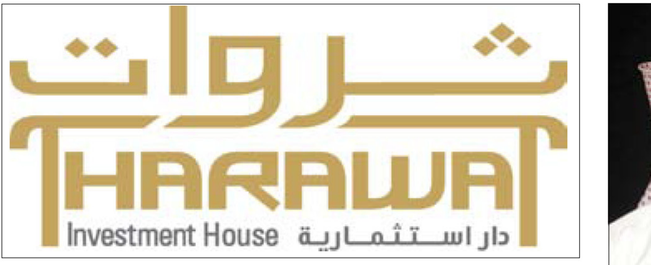
تشارك في مؤتمر «الحلول الإسلامية» شخصيات من 45 دولة

وأضاف العلوي، في بيان صدر عن «دار ثروات» أمس، قوله: «يأتي المؤتمر الذي يشارك فيه أكثر من 1000 من قادة وخبراء المصارف المشهورين عالمياً وسط تكهنات وتعليقات بأن الوضع الحالى هو الأشد